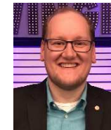
Seminarleiter Diplom-Berufspädagoge, systemischer Berater, Supervisor in Ausbildung

Die Veranstaltung wird für das Fortbildungszertifikat der Ärztekammer Sachsen-Anhalt angemeldet